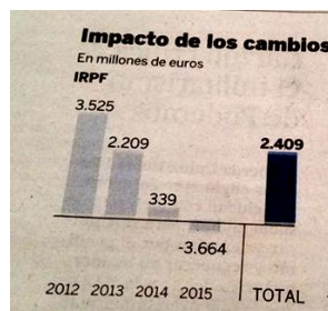
Figura 5. Diagrama de barras con errores en el tamaño de la barra

Este tipo de error, posiblemente con una clara intencionalidad política, aparece en la Figura 6. Los tamaños de las barras no solo no coinciden, sino que cuando se comparan los valores de las frecuencias de distintos valores de la variable, en este caso 2013 y 2015, a cantidades menores le corresponden tamaños de barras mayores. En este ejemplo se pretende mostrar una tendencia positiva y creciente de los datos, aunque este crecimiento en realidad no es secuencial.