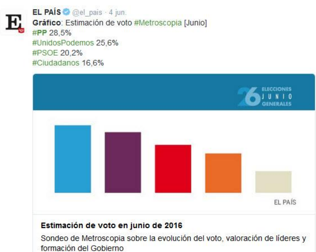
Figura 2. Diagrama de barras sin ejes

La eliminación de los ejes en un gráfico de barras puede provocar, al igual que el caso anterior, una falsa percepción de las proporciones, aunque el gráfico en cuestión si mantenga proporcionalidad en las distintas barras. Gillan y Richman (1994) mostraron que la existencia de ejes X e Y mejora la interpretación de las gráficas, ya que el tiempo de respuesta ante la información era menor que en las gráficas exentas de ejes.