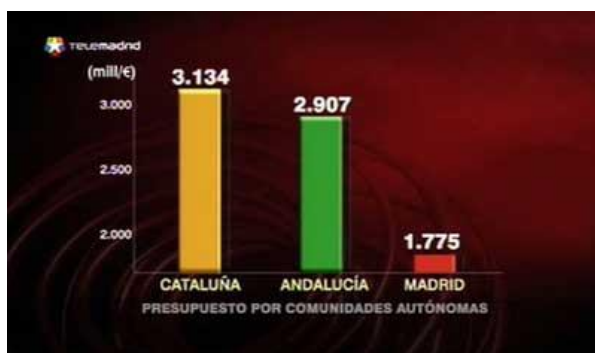
Figura 3. Diagrama de barras truncado en el origen

Como se observa, el creador del gráfico quiere resaltar las diferencias existentes, que serían apreciables de igual manera con un gráfico correcto, entre las dos primeras comunidades autónomas respecto a la comunidad de Madrid, manipulando la percepción del lector y provocando que la interpretación esté condicionada por las actitudes o predisposiciones de éste respecto del tema en cuestión.