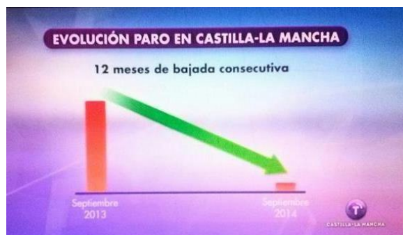
Figura 7. Diagrama de barras con información manipulada

FSC 2: El gráfico en su conjunto tiene una clara intencionalidad política; pretende provocar en el lector la percepción de que el problema del paro se está resolviendo. A juzgar por el tamaño de la barra correspondiente a 2014 y la fuerte pendiente negativa de la flecha, el paro en Castilla - La Mancha es prácticamente inexistente (“leer más allá de los datos”).