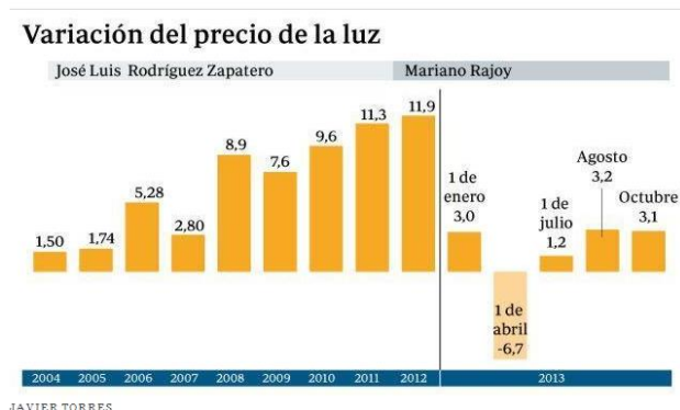
Figura 4. Diagrama de barras con varias escalas de valores de la variable

El lector de la información debe asignar un claro significado político al mensaje visual transmitido por el gráfico. Esto supone un nivel de lectura crítica del gráfico que se corresponde con el nivel descrito por Friel, Curcio y Bright (2001) como “leer más allá de los datos”.