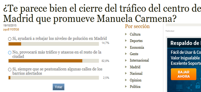
Figura 8. Diagrama de barras de una muestra no probabilística

En el ejemplo de la Figura 8, se muestra un diagrama de barras de una encuesta realizada mediante la web de un medio de comunicación. Por tanto, la interpretación de los resultados está sesgada, al ser el muestreo no probabilístico, los participantes de la encuesta parten de la premisa de ser lectores de este medio de comunicación, por tanto, ideológicamente cercanos a este medio y los resultados dependerán de ello.